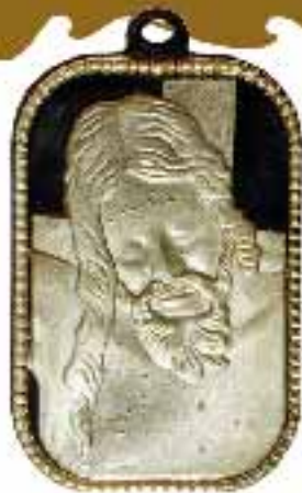
Tamaño real de la medalla: 1,8x2,7 cm.