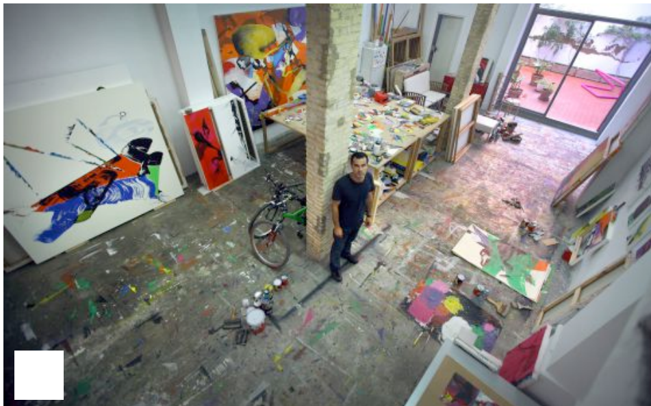
L'antic sequer d'arròs ha estat transformat en un estudi agradabilíssim.

Li pregunte si alguna vegada pinta la gent que estima, com ara la seua dona i la seua filla, encara que siga una pintura domèstica i íntima. Em diu que no, però que els té molt presents, i que són els estímuls els que hi ha reflectits. Els colors de la vida: “Per exemple, la meua filla menjant prunes: vaig intentar fixar el color morat i tan especial d'aquesta fruita”. I afig: “Fa tres anys, va morir mon pare i allò va moure una investigació sobre el color negre que finalment va acabar en una sèrie”. M'ensenya algunes obres i m'agraden molt: contenen el gest tan expressiu de l'artista i, al mateix temps, una sobrietat, una contenció, que en molts aspectes reforcen la seua pinzellada. De vegades, l'excés de color d'alguna de les seues obres pot ser enlluernador, i un gra massa. En canvi, la gamma de negres i grisos conté tot el seu llenguatge i, a més a més, projecta una sòbria elegància.